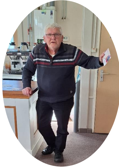
2 e Doede Rijploeg